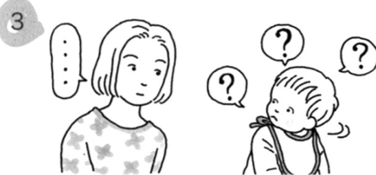
振り向いてもいつも知らん顔をされたり、お母さんの表情がわかりにくかったりすると顔を見なくなり、自分勝手に動くようになり、不安でお母さんから離れなくなったりすることもあります。

笑顔は 「あなたの行動はOKよ！」 「あなたは大事な子よ」 「あなたが大好きよ」 という メッセージです。