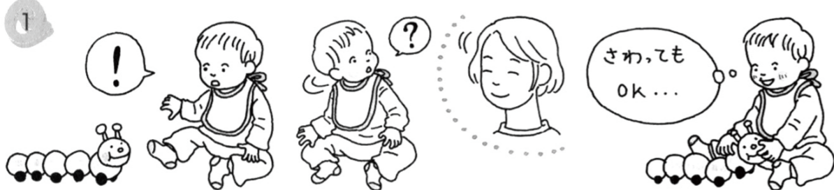
赤ちゃんは、新しいことに会った → お母さんの表情を頼りにして、 → その表情を元に行動します。り、困ったことがあったりすると、

小さいときに笑顔のメッセージを受けとった子は、自分に自信がもてます。新しい行動への意欲もぐんぐんわいてきます。わが子にも、よその子にも、『笑顔のメッセージ』をたくさん贈ってあげましょう！