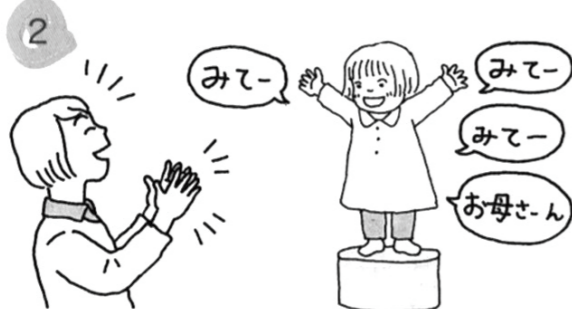
小さな子は、喜びや驚きを感じるとお母さんに共感を求めます。