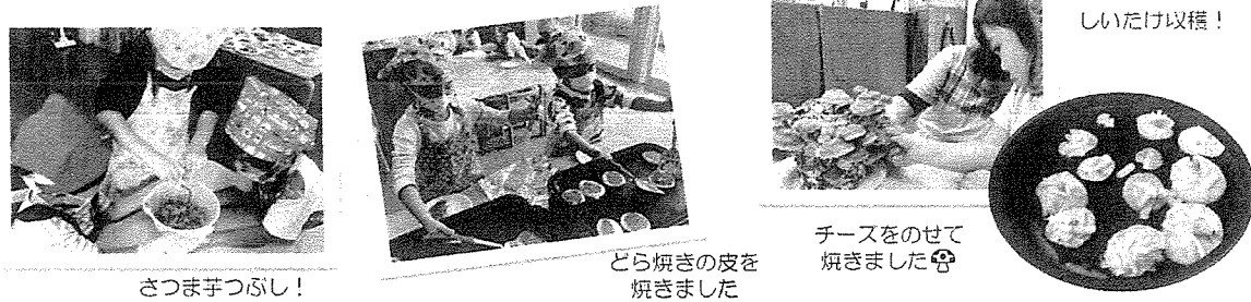
さつまいもあんの どうら焼き完成!

くま組さんでは、芋掘りのさつまいもを使って「芋あんどうら焼き」作り、ばんだ組さんでは、お部屋で育てているしいたけをミニ調理。フライパンで「チーズ焼き」を作り、とれたてを味わいました。