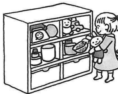
片づけられる高さと同量