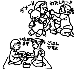
大人のおねをしながらか社会に必要なスキルを獲得します。かわりによって言葉も育ちます。