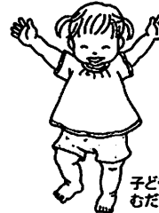
子どもの行動にむだはありません

1歳児は、歩くこと、体を動かすこと自体が遊びです。全身を動かし、五感をフルに使って遊ぶことによって、身体感覚と自己認識を確かなものにしていきます。