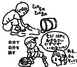
受け入れがたい現実を、遊びにくくすることで消化します。

遊びは正解がありません。遊びのルールは、状況に合わせて柔軟に変えることができます。遊びの中では、どの子も同じように失敗を経験します。幼児期に、柔軟でたくましい心を身につけた子どもたちは、苦労や挫折を軽々と乗り越えていけるでしょう。