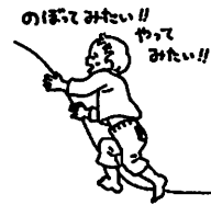
環境を探索し、挑戦することによって意欲がわいてきます。