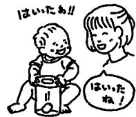
「できた!」「自分うまくやれる」という自信は大きく育ちます。