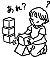
物の性質・形 大きさ・量 色 質感・数 空間認識 原因と結果 etc etc.....