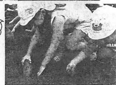
うんとこしょ、どっこいしょ!